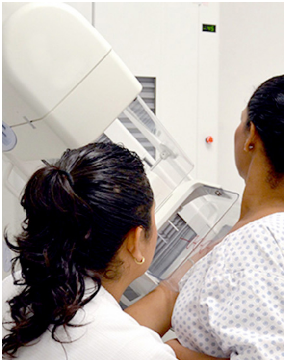
Paciente realizándose una mastografía