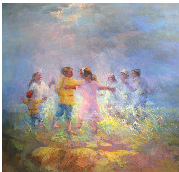
Título: La Ronda Autor: Hermenegildo Sosa