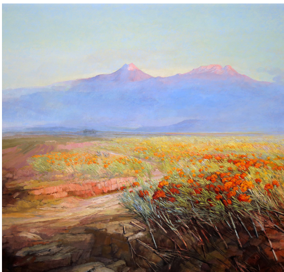
Título: Montañas Autor: Hermenegildo Sosa