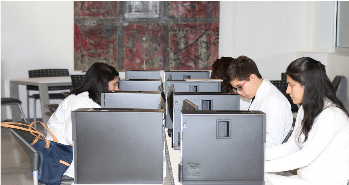
Espacio de consulta digital de la Biblioteca del INCMNSZ

Los profesores y alumnos de la Facultad de Medicina de la UNAM tienen acceso a revistas, libros y bases de datos, contratados por la Facultad. Estos sitios no residen en los servidores del Instituto, por lo tanto no es posible garantizar el acceso en todo momento.