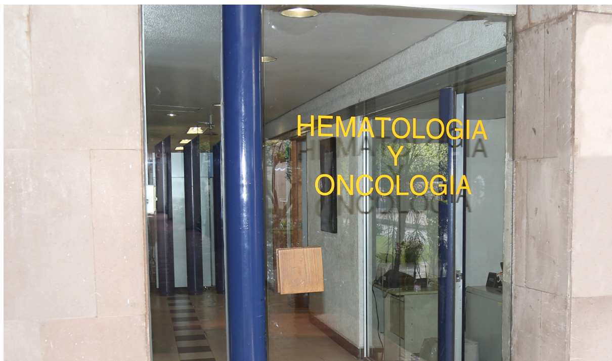
Departamento de Hematología y Oncología

A partir del 2001 y hasta la fecha, es profesor del curso de posgrado de Oncología Médica, reconocido por la UNAM, con sede en el INCMNSZ. De marzo del 2013 hasta la fecha es profesor del curso de alta especialidad de Trasplantes de Células Progenitoras Hematopoyéticas en adultos del propio Instituto.