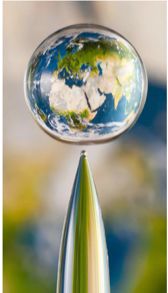
Fotografía tomada desde el espacio por Markus Reugels, creando un efecto parecido con el trabajo de M.C. Escher.

Si deseas conocer más información al respecto, consulta la página institucional en la sección Nuestro Entorno.