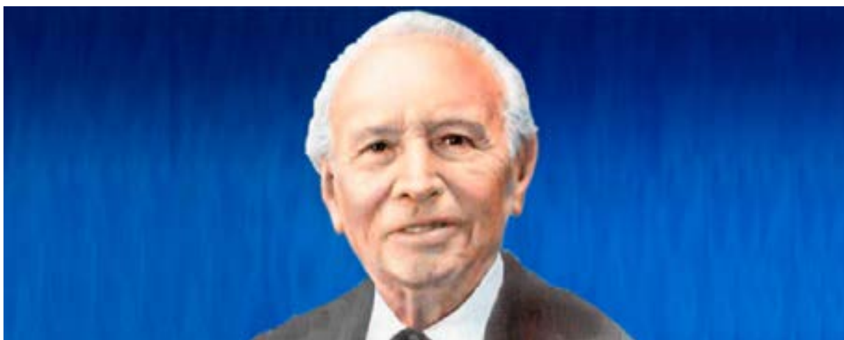
Dr. Salvador Zubirán Anchondo

Copia fiel del texto escrito por el Dr. Salvador Zubirán en el Libro Conmemorativo del XXX Aniversario, 1976