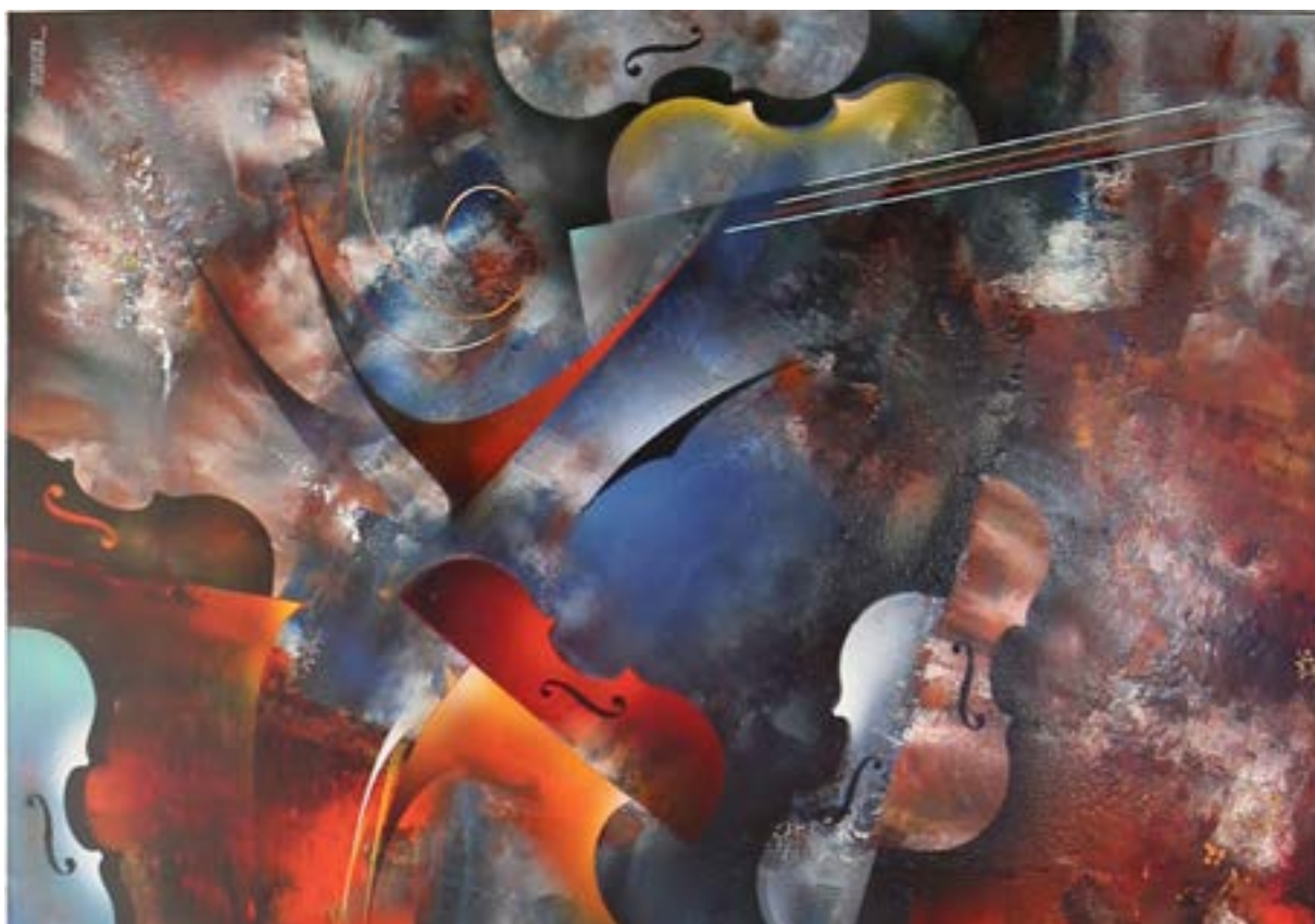
Autor: Leonardo Nierman Nombre: Preludio Sinfónico

El inicio de su trayectoria por el mundo de las artes plásticas comienza en los años cincuenta. El discurso pictórico de su primera época da cuenta de influencias notables: Kandinsky, Klee, Miró y De Chirico le abren una ventana a la abstracción y a las corrientes en boga como el surrealismo y el cubismo. Su trabajo artístico remite al macro y al microcosmos, al surgimiento del universo, la tierra y los espacios interestelares; todo ello, plasmado con un discurso y estilo inconfundible. Su pintura posee una característica fundamental, día a día se transforma, compartiendo sus sueños con quien se acerque a ella. Leonardo Nierman ha sido prolífico; pinturas, tapices, esculturas, que se han exhibido mundialmente.