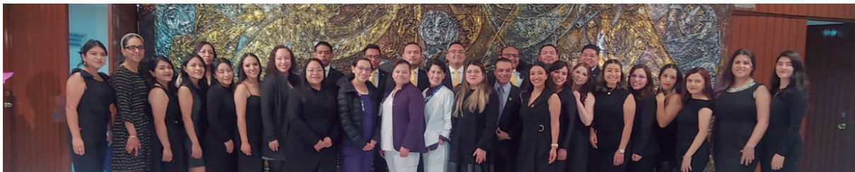
Generaciones XVI y XVII en la Ceremonia de Clausura del ciclo académico 2024-2025