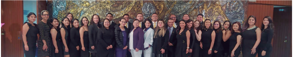
Generaciones XVI y XVII en la Ceremonia de Clausura del ciclo académico 2024-2025