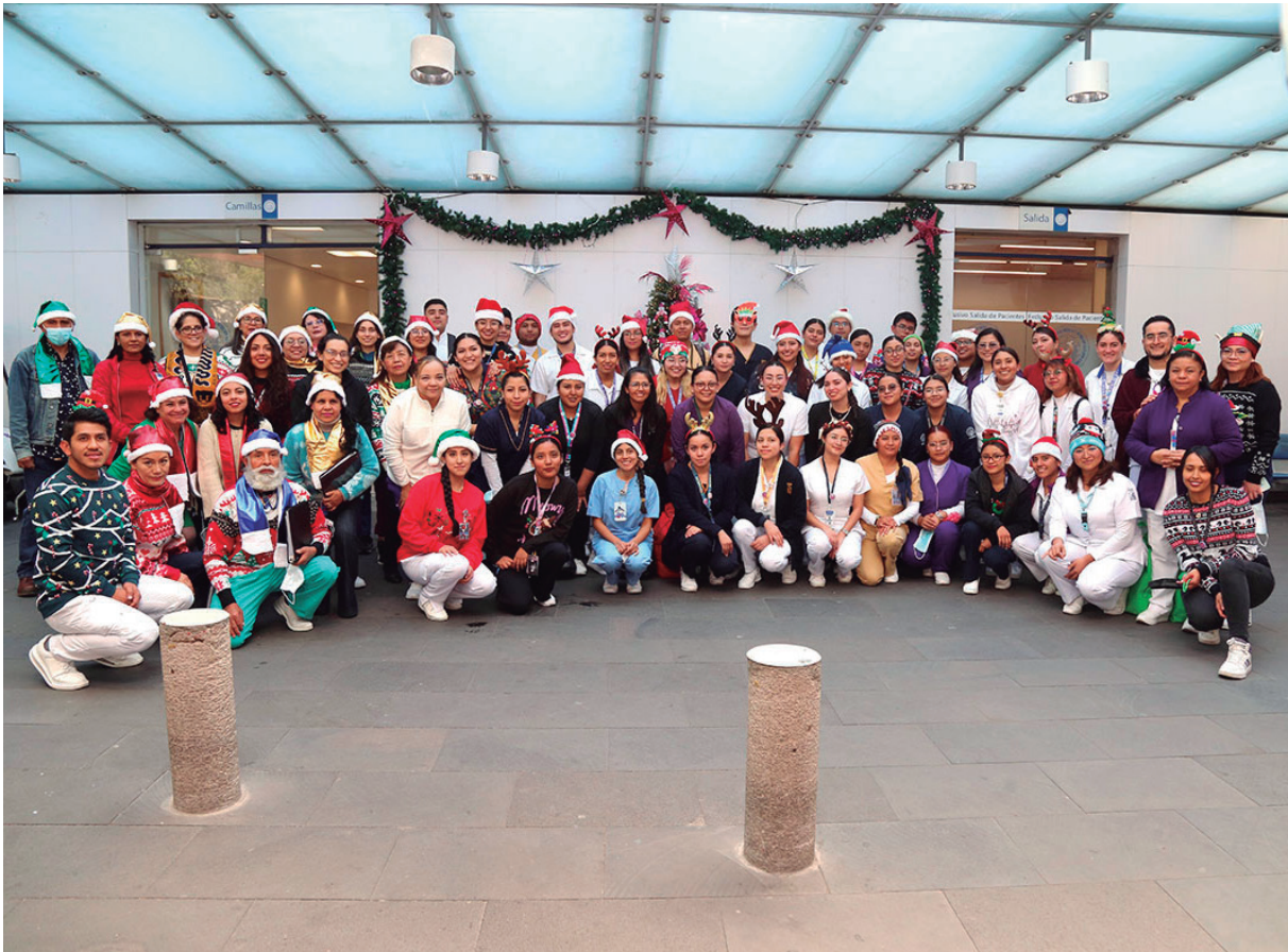
Dirección de Enseñanza, Diversas áreas de la Subdirección de Enfermería, Prestadores de Servicio Social e integrantes del Coro del INCMNSZ

Las cartas entregadas fueron elaboradas por los prestadores del servicio social de Enfermería, quienes entregaron los calcetines y cartas a pacientes y sus familiares de urgencias y de diversas áreas de hospitalización del Instituto. Todo esto, en compañía del Coro INCMNSZ, quienes interpretaron villancicos navideños.