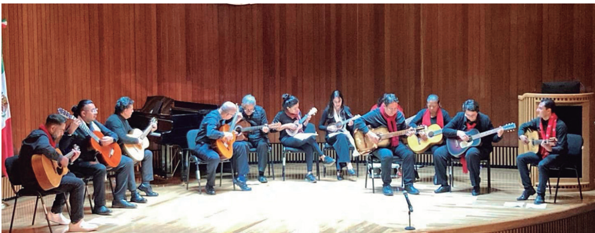
Personal del INCMNSZ, que pertenece al grupo que toca guitarra o ukelele