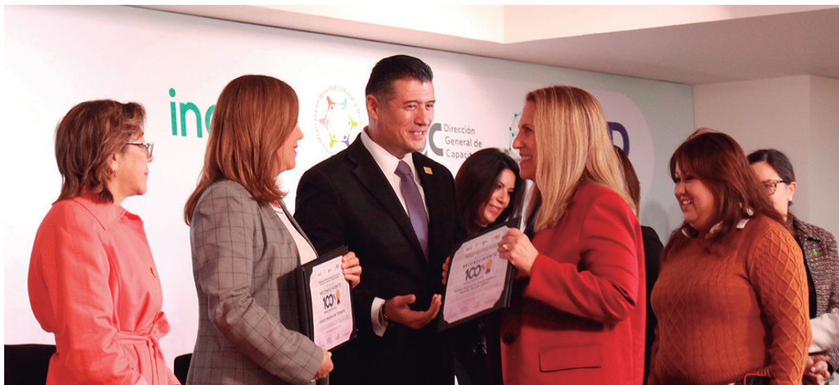
Entrega del reconocimiento como Institución y Comité de Transparencia 100% capacitado al INCMNSZ