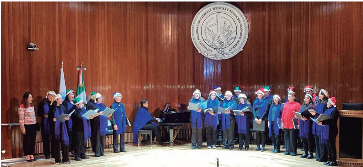
Miembros del Coro del INCMNSZ

Como parte de los actos conmemorativos de las fiestas decembrinas y de fin de año, el Coro del INCMNSZ llevó a cabo el concierto para pacientes y familiares, "Navidad entre amigos", en el Auditorio del propio Instituto, el pasado 18 de diciembre. El objetivo: brindar un momento de esparcimiento y alegría a la Comunidad Institucional, de la que son parte nuestros pacientes y sus familiares.