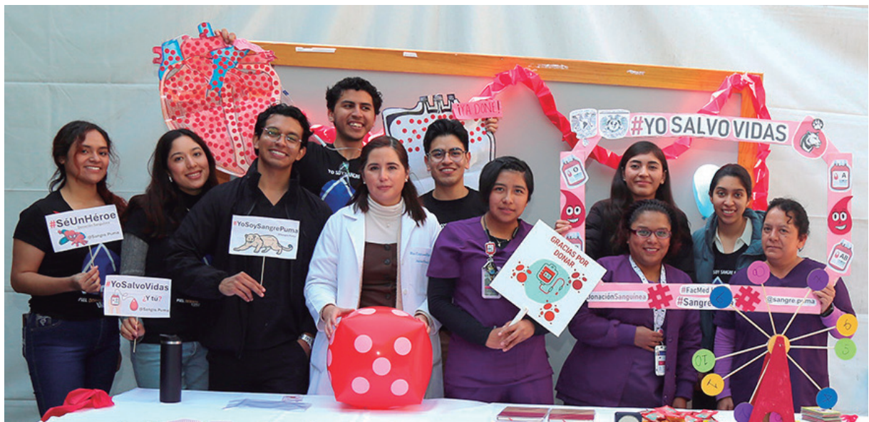
Campaña de Donación Altruista de Sangre, en la explanada del Quijote del INCMNSZ

Información para la donación: https://www.incmnsz.mx/2022/trip-DONACION-SANGRE.pdf