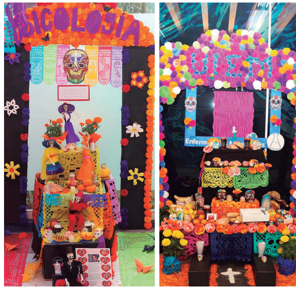
Departamento de Neurología y Psiquiatría Unidad de Investigación de Enfermedades Metabólicas