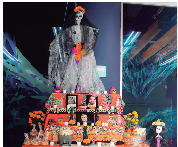
Sindicato Único de Trabajadores del Instituto SUTINCMSZ