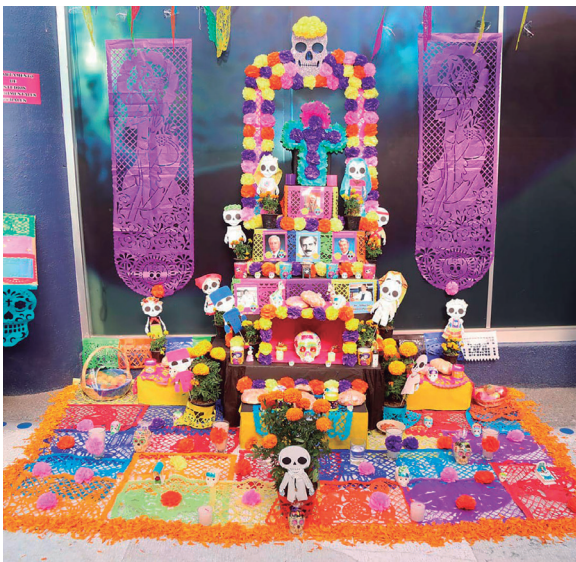
Departamento de Estudios Experimentales y Rurales