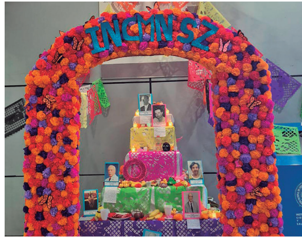
Escuela de Enfermería "María Elena Maza Brito"