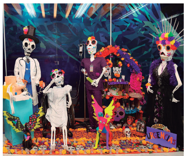
Segundo lugar: Departamento de Atención Institucional Continua y Urgencias