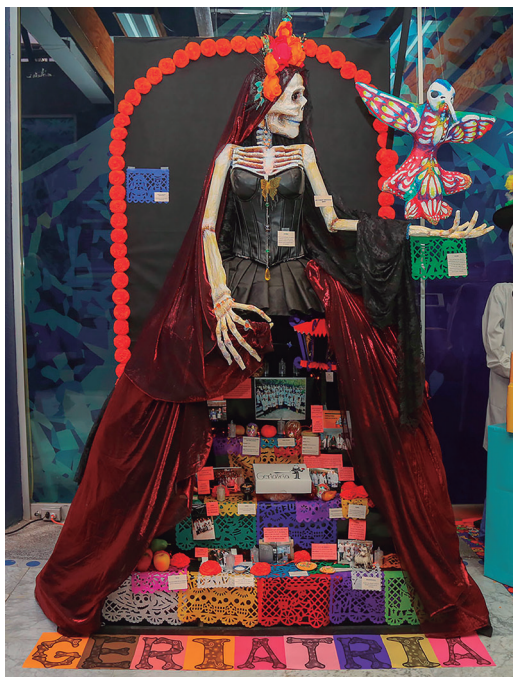
Primer lugar: Servicio de Geriatría

Algunas de las áreas que colocaron ofrendas en sus espacios de trabajo, fueron las siguientes: Estudios Experimentales y Rurales, Unidad de Enfermedades Metabólicas, Carpintería, Psicología, Recursos Humanos, la Dirección General, la Unidad del Paciente Ambulatorio, Escuela de Enfermería y Servicios Subrogados, entre otros.