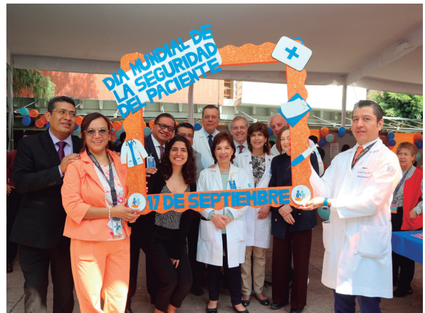
Inauguración del Día Mundial de la Seguridad del Paciente

Todas las estrategias buscan la atención con calidad y con seguridad, las cuales quedan reflejadas en cada uno de nosotros, desde el compañero que vigila la puerta hasta el mayor de los directivos.