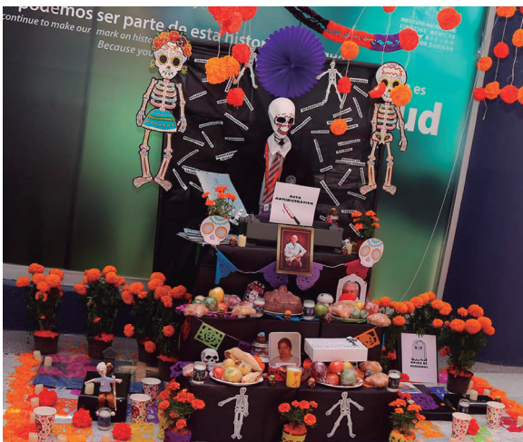
Subdirección de Recursos Humanos