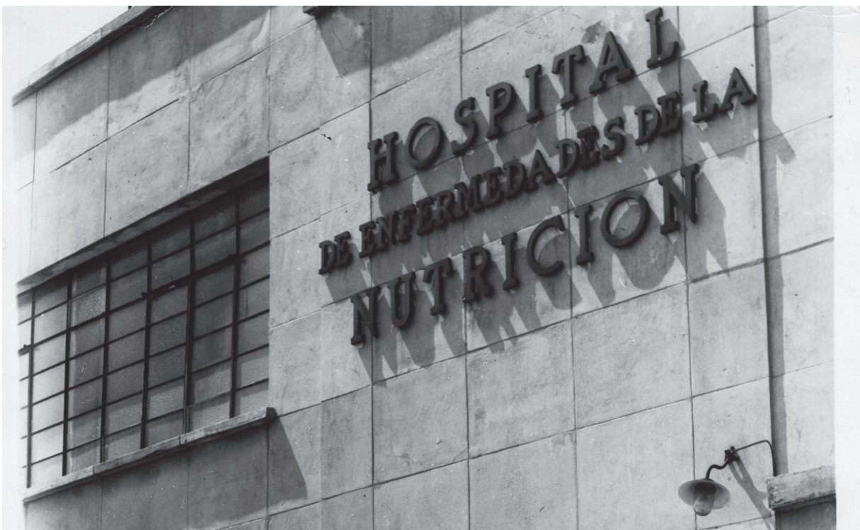
(Originalmente el pabellón número 9 del Hospital General de México, Dr. Eduardo Liceaga)