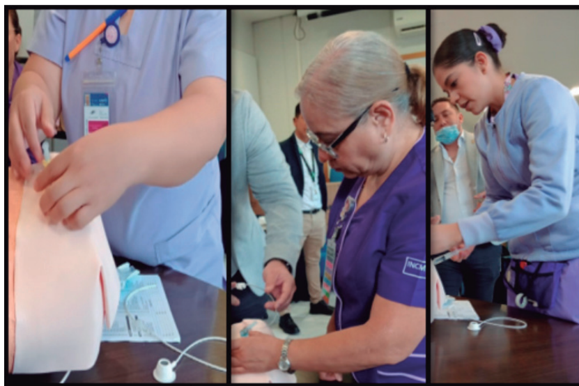
Enfermeras del INCMNSZ en capacitación

Contar con personal capacitado contribuirá a la reducción de errores en el cuidado, mejorando la seguridad de los beneficiarios en un marco de calidad y humanismo.