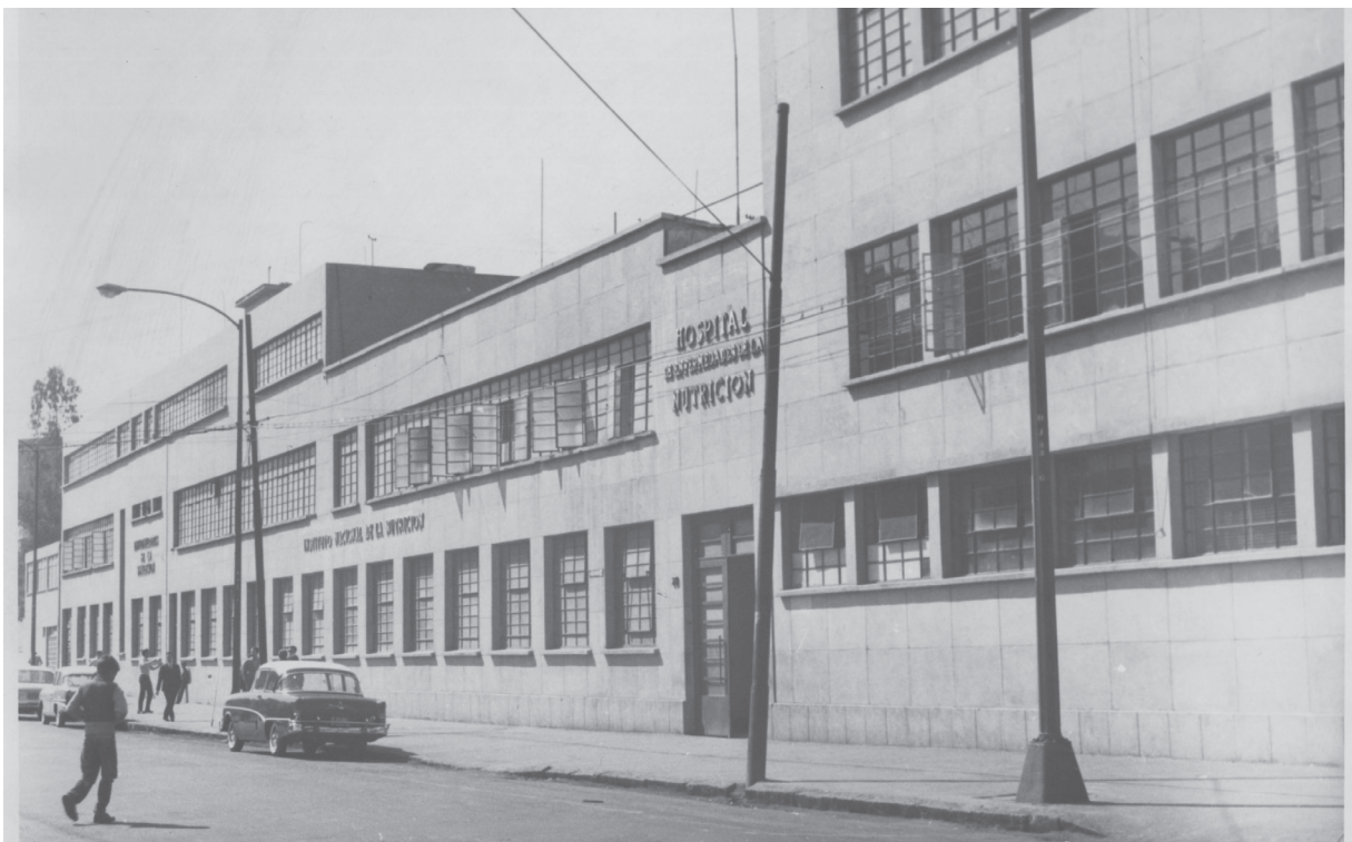
Hospital de Enfermedades de la Nutrición, HEN 1950