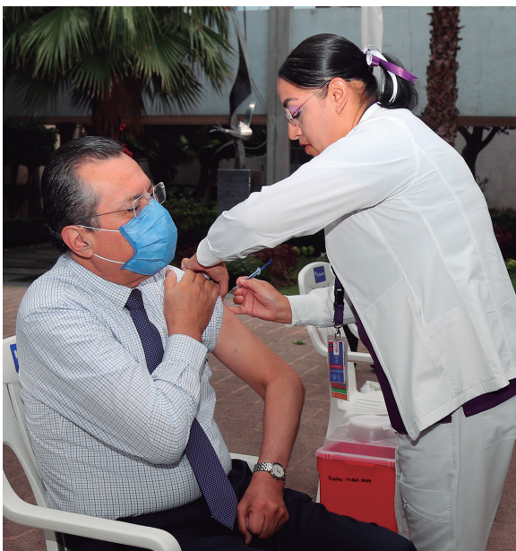
Campaña de Vacunación contra la Influenza 2024

Por ello, es un enorme beneficio aplicar la vacuna. Invito a todo nuestro personal a que se vacunen como parte de la estrategia de prevención que establece el Gobierno Federal; que se suma a nuestra campaña interna de Vida Saludable”, concluyó.